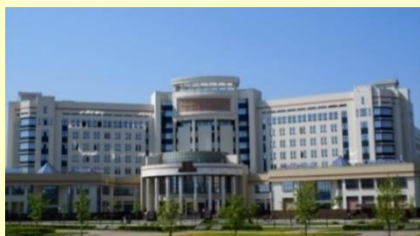
Здание Шуваловского корпуса МГУ им. М.В.Ломоносова (Ломоносовский пр-т, д. 27, корпус 4)